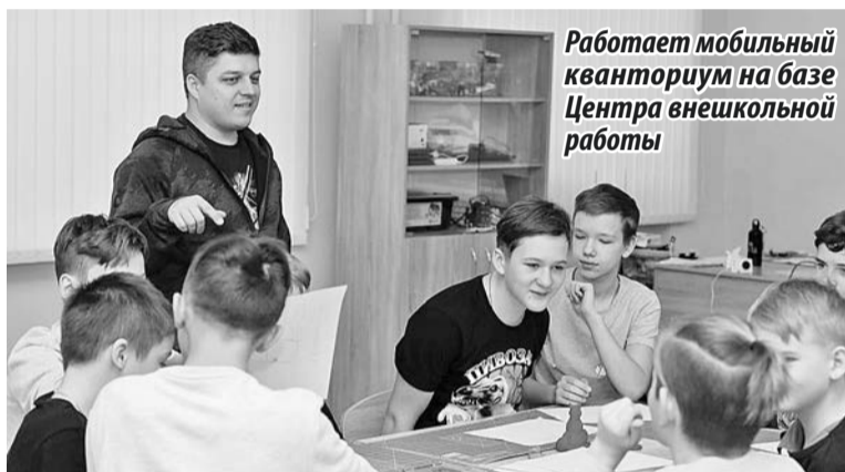
Работает мобильный кванториум на базе Центра внешкольной работы

Создание кванториума в новой школе позволит значительно увеличить количество детей, которые будут получать дополнительное образование технической направленности.